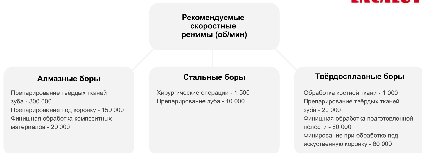
Рис. 2. Форма рабочей части бора и область применения